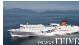
新・オレンジフェリー