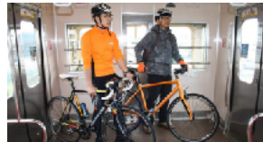
サイクリストの乗車

日本の鉄道においても、地域の活性化のためにサイクル・トレインを実施している路線が増え、観光や旅行者だけでなく、住民の利便性で関心を集めています。