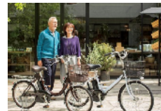
電動アシスト自転車