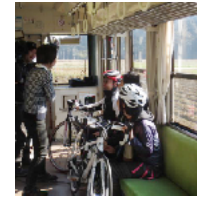
住民との触れ合い