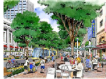
コンパクトシティー

ヨーロッパの都市交通では、エコで環境に優しいことから、都市の中心部から自動車を排除し、代わりにLRT(軽量軌道交通)と自転車を組み合わせたインフラが新しく採り入れられています。