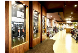
フリーパワー直営店