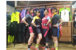
サイクル・ファッション