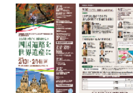
四国巡礼世界遺産