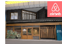
JR池田駅前の簡易宿泊施設