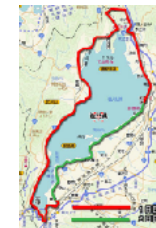
琵琶湖一周コース

※ 琵琶湖をランニングや自転車一周することが「ピワイチ」と言われて、目標になっています。四国一周を「シコイチ」として売り出します。