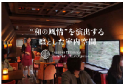
「四国まんなか千年ものがたり」

※ オレンジ・フェリーや南海フェリーだけでなく、四国の魅力を創造し、サンフラーの再就航や新規参入を促し、東京方面からのアクセスも期待します。