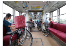
地域生活者の利用