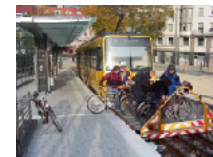
自転車を別に運搬