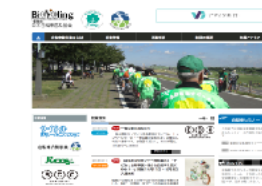
日本自転車普及協会