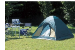
サイクル・キャンプ場